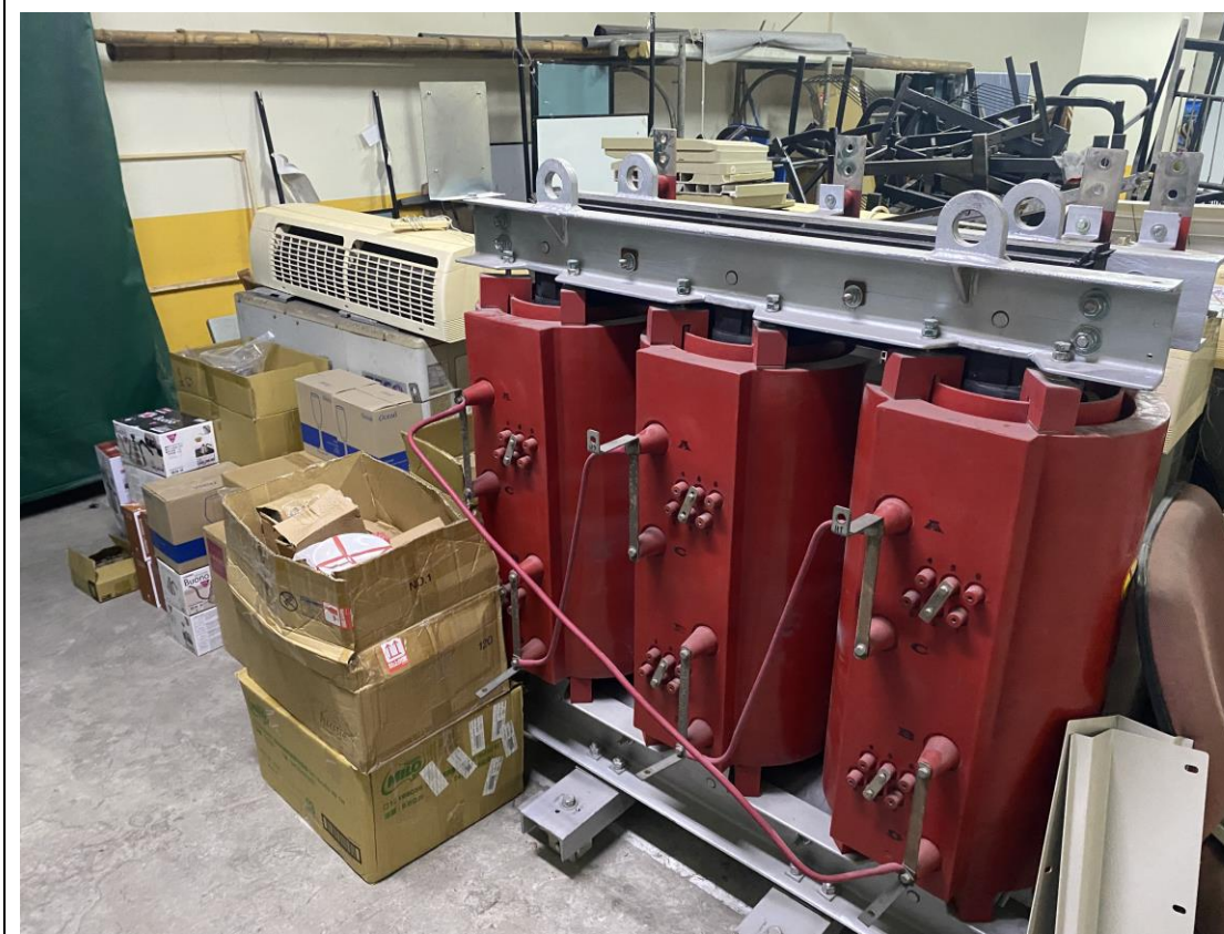
冷氣及油浸式變壓器