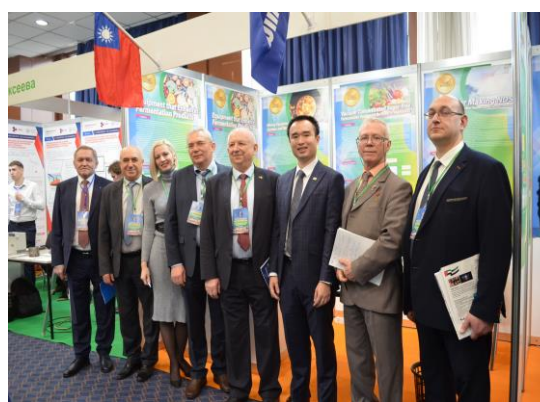
▲ 當地廠商蒞臨台灣展區洽談合作