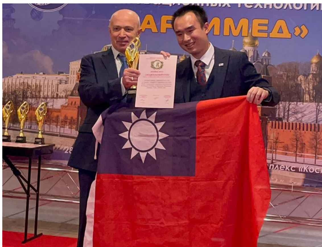
▲ 大會主席 Dmitry Zezyulin 頒發獎項給 TIPPA

格外珍貴的是，參展團隊成員橫跨教育研發單位、生醫界大廠等，作品類別包含生技、醫療、農業技術、生活用品等，創造力豐盛多元，是非常具潛力與實踐力的發明協會，相當期待TIPPA未來帶領更多作品再闖俄羅斯與世界發明平台！