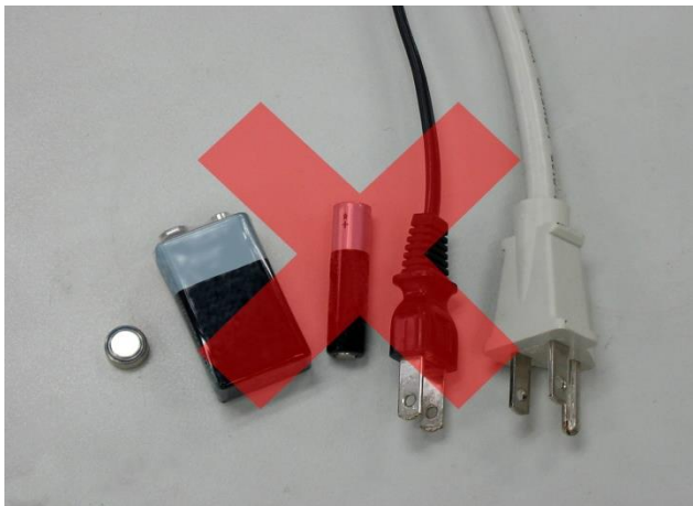
需使用電力的工具